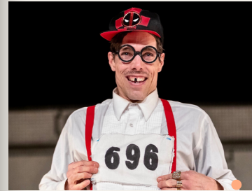
Bande-annonce ici / Promo video here (vimeo) Bande-annonce ici / Promo video here (youtube)

12h, 50 minutes, Non-verbal Hugues Sarra-Bournet, Montréal